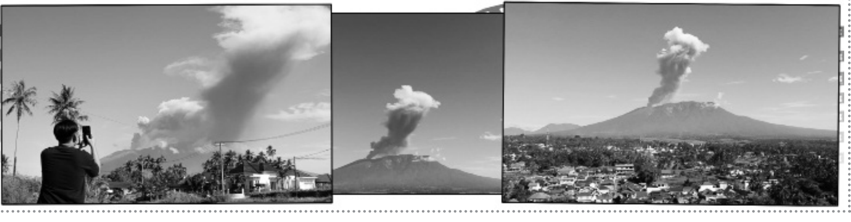
آتشفشان مراپی در استان سومترای غربی اندونزی فوران کرد و ستونی از خاکستر را تا ارتفاع ۲ کیلومتری به آسمان فرستاد؛ مقام‌های محلی همچنان ورود و فعالیت در شعاع ۳ کیلومتری مرکز فوران را ممنوع اعلام کرده‌اند.