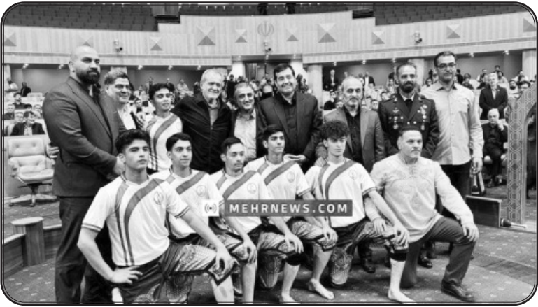
جنگ ۱۲ روزه/ بزرگداشت شهدای میناب توسط ملی پوشان فوتبال