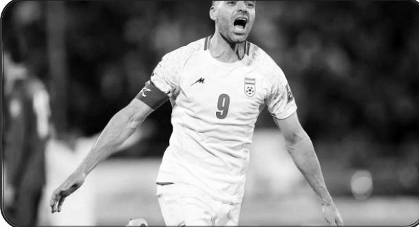
طارمی تجربه حضور در دو دوره جام جهانی را در کارنامه دارد:

سابقه حضور طارمی در جام جهانی آمار کلی طارمی در جام جهانی: ۲۰۲۶ بازی‌ها: ۳ بازی (مرحله گروهی) گل: ۲ گل توضیح: ایران در این دوره با تیم‌های اسپانیا، پرتغال و مراکش