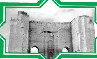
مسجد اربک علیشاه تبریز