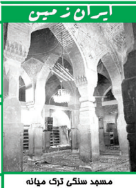
مسجد سنگ ترک مهانه