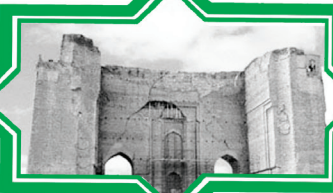
مسجد اربك علیشاه تبریز