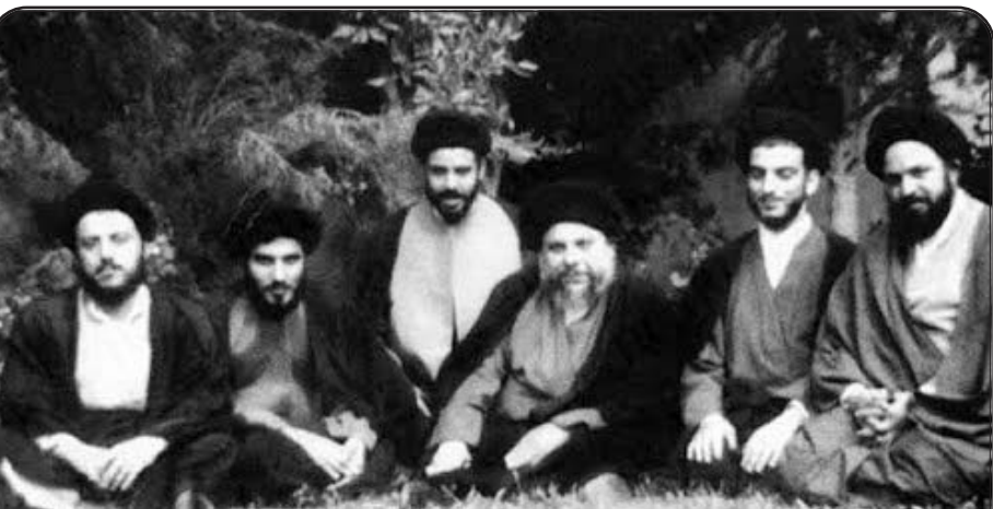
تصویری از شهیدان سید محمد باقر الصدر و سید محمد باقر الحکیم به همراه مرحوم هاشمی شاهرودی و دیگر یاران

شهید صدر اما در پاسخ به این تلگراف، پیام امام خمینی (ره) را دلگرمی برای خود دانستند و رهبر انقلاب ایران را از عدم قصد خود برای مهاجرت مطلع ساختند. با این