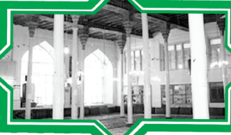
مسجد جامع عجب شیر