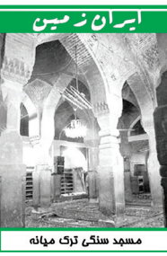
مسجد سنگی ترک میانه