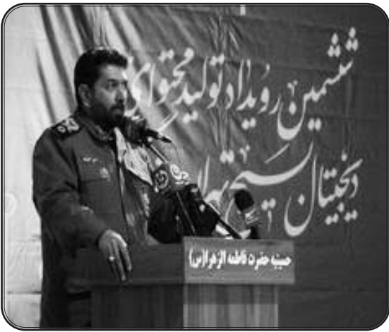
سردار سلیمانی داشتیم، رویداد تولید محتوا دیجیتال بسیج برگزار می‌شود.

مهمترین ابزار فضای مجازی و شبکه‌های اجتماعی است و به فضل پروردگار و ارتقا بسیار خوبی که در این ۶ سال با تدابیر