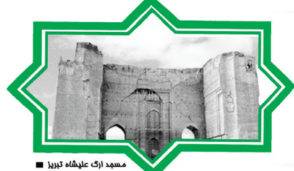
مسجد ارك علیشه غورا