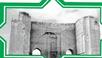
مسجد ارگ علیشاه تبریز