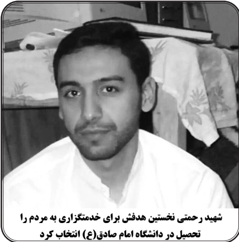
شهید رحمتی نخستین هدفش برای خدمتگزاری به مردم را تحصیل در دانشگاه امام صادق(ع) انتخاب کرد

کلیدواژه چهارم برای تقویت اراده، الگوسازی بود و خواندن کتاب‌های استاد عشق مربوط به زندگی پرفسور حسایی، مهر استاد مربوط به زندگی علامه جوادی