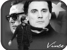
م اف آدریاجان: ۷۳۱

کونتس که در روزهای پایانی شهریور ماه دو سال پیش جانشین شتول گونش در تیم ملی فوتبال ترکیه شد، در این مدت در ۲۰ بازی روی نیمکت این تیم بود و آمار ۱۲ برد، سه تساوی و پنج شکست را از خود برجای گذاشت. این مربی آلمانی اما پس از نمایش ضعیف ترکیه در دو بازی اخیر این تیم (تساوی یک – یک مقابل ارمنستان در مرحله انتخابی یورو ۲۰۲۴ و شکست ۴ بر ۲ در بازی دوستانه مقابل ژاپن) از سمت سرمربیگری ترک‌ها اخراج شد.