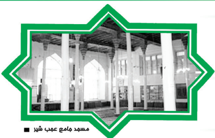
مسجد جامع عهد شیر

www.azarbaydgan.ir ISSN ۲۲۲۲-۲۲۲۷ لیتوگرافی آذین/ چاپ پرنیان