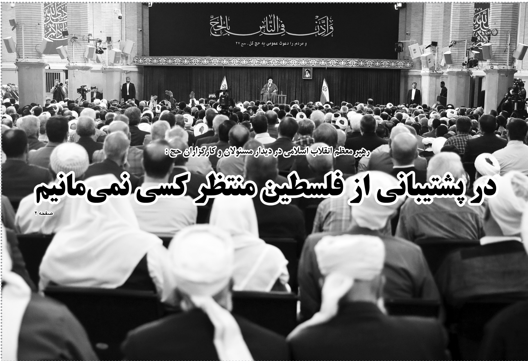
رهبر معظم انقلاب اسلامی در دیدار مسئولان و کارگزاران حج: مردم را دعوت عمومی به حج کن. حج ۲۷